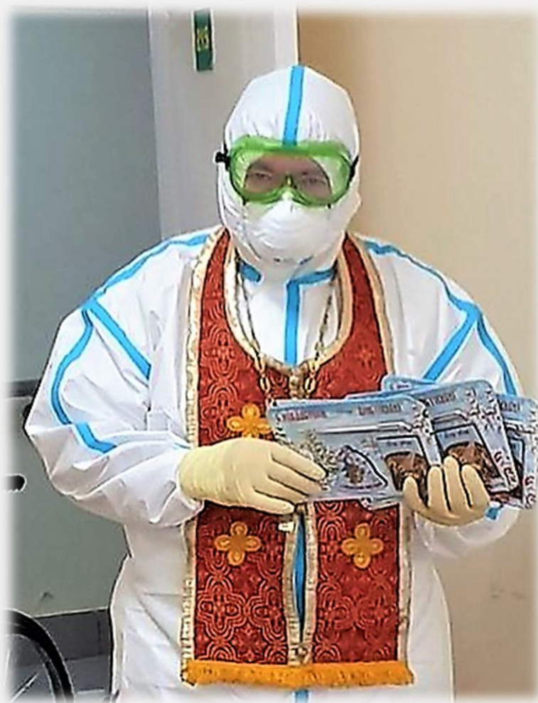
В 2020-2021 гг. священники Ярославской епархии несли свое служение в «красной зоне» ковидных больниц