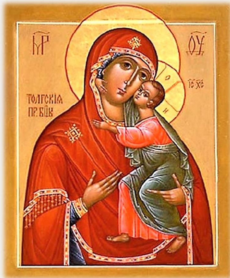
Икона Толгской Божией Матери