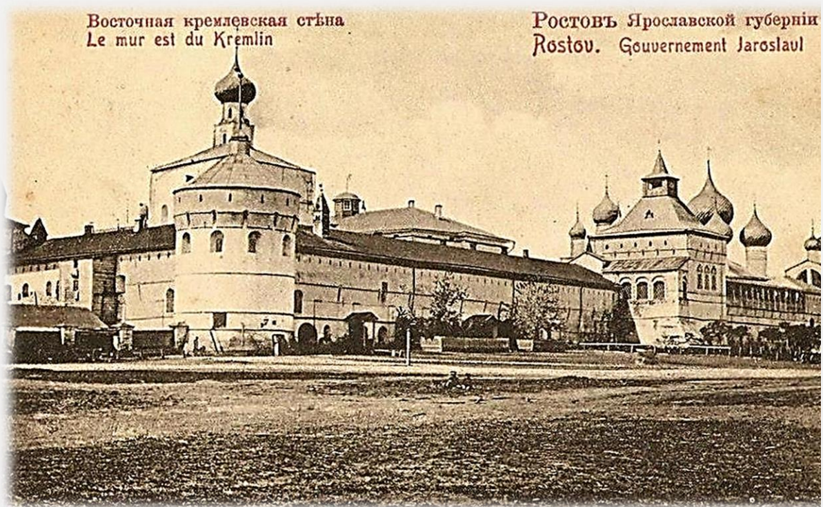
Ростовский кремль – резиденция митрополита Ростовской епархии