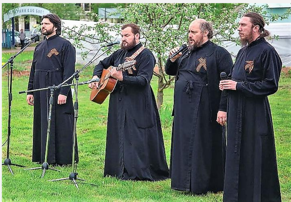
Концерт ансамбля духовенства Ярославской епархии в парке 30-летия Победы (20 июня 2021 г.)