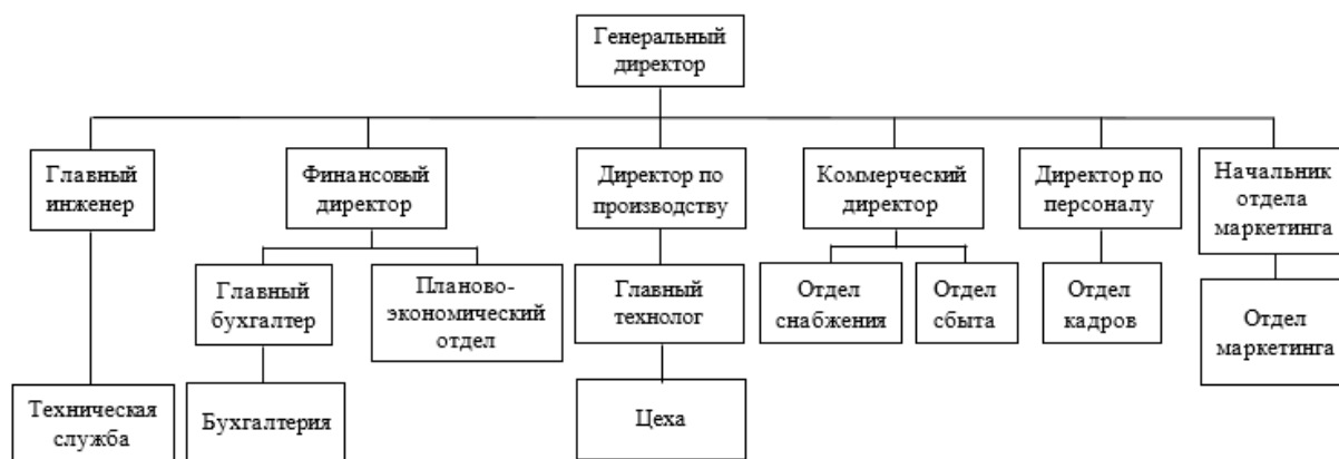
Рисунок 1 - Организационная структура хлебопекарного предприятия «Колос»

Организационная структура предприятия представлена на рисунке 1.